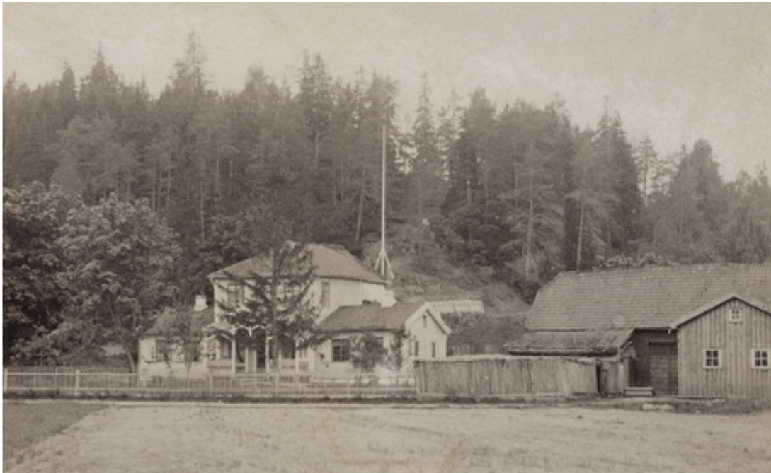
Karenslyst ca. 1880.

Polemikken om Navnet bevirket at de neste annonser ikke l ngere refererte til Karenslyst, men omtalte stedet som "Pavillonon paa Ladegaards en".