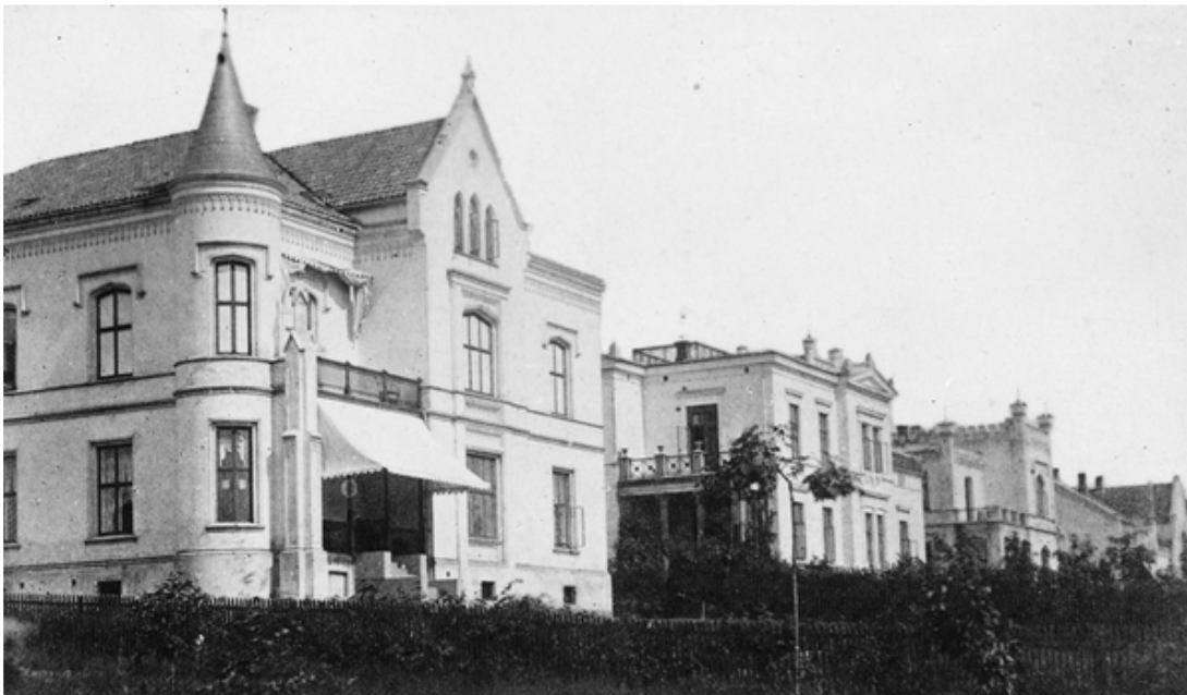
Incognitogaten 5, 3 og 1.

I gjesteværelset var foruten en mahognyseng, den lille sofa i pseudorokoko som jeg har, det tilhørende bord og et par lenestoler, alle i grønt plysj samt over sofaen det tilhørende speil. I gjesteværelset holdt vi barn til mens de voksne sov middag efterat vi først hadde tumlet op og ned trappen og var blitt manet til ro av stuepiken som passerte oss til og fra entredøren,