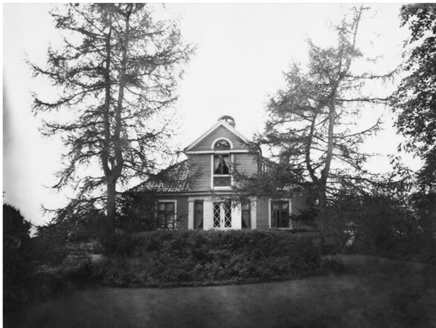
Løkken, Villa Terningbakken, Drammensveien 82.