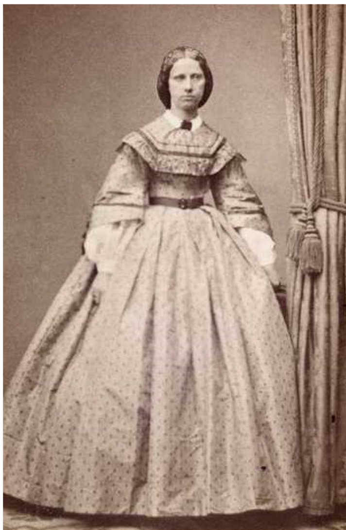
Foto ca. 1860-1865